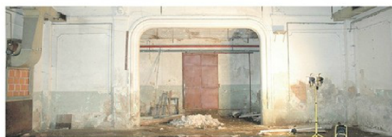
Kazalište u sklopu Tvornice duhana – Teatrino u »Benciću«

Teatro Thalia na Kalvariji (danas KUC Kalvarija, sjedište RI Teatra)